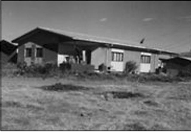
Náš dům, kde jsem strávil celkem 420 dní pobytu v Etiopii.

natírá vápnem. Má přijet vládní delegace v čele s Mengistu Haile Marianem a jeho osobní gardou. Pro něho se chystá heliport. Oficiální datum návštěvy bude ale až v dubnu. Začíná období malých dešťů, počasí se trochu vylepšilo. Už se tolik nepráší a občas bývá zamračeno. Na večer bývají bouřky a nefouká tolik vítr. Sluníčko máme přímo nad hlavou, jak postupuje na sever.