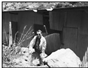
Havárie kanceláře - kámen proletěl oknem a otevřel si dveře.

V neděli 12.6. jedeme dvěma auty na krátký výlet (asi 40 km) k vodopádům na říčce Maribo. Dalo by se to nazvat výletem do doby kamenné. Říčka v jednom místě vytváří vodopády o šířce asi 80 m nazvané Heb Fapati. Za padající clonou vody, kam se dá vejít z boku, je jeskyně do hloubky asi 20 m a zde žijí