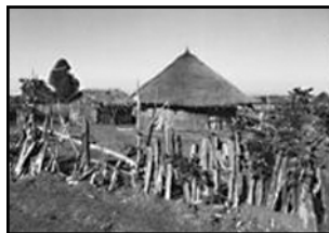
Plot z opuncí kolem domků.

lidé. Jejich obydlí tvoří kamenná ohrada asi 5 x 5 m, výška 1 m, na zemi suchá tráva na spaní a uprostřed ohniště. Dali jsme jim několik plechovek od konzerv a PET lahví, bylo to pro ně úplně bohatství. Na druhé straně jeskyně bylo místo pro dobytek. Strop byl úplně černý od kouře a tím se tma, ve které tam žili, ještě zvětšovala. Okolo vodopádů byla krásná tropická vegetace, obrovské stromy s liánami, krásné květiny, zelená travička. Na stromech se proháněly opičky gurézy. Jsou černobílé a při skoku krásně plachtí.