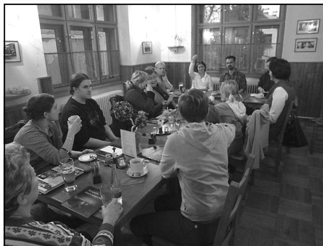
Zajímavé vyprávění manželů Havlínových o zásadách aranžování bylo poučné pro všechny účastníky soutěže.