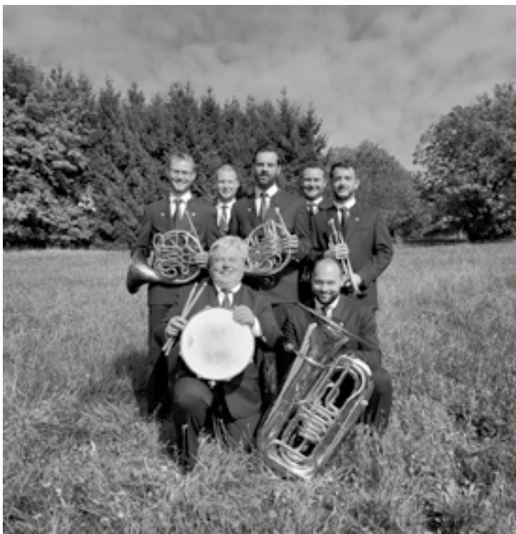
Markazíni na Arnoštově v říjnu 2023 při natáčení videoklipu k písni „Když je ti ouvej“