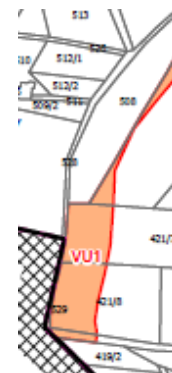
zpřesnění Změnou č. 1

v souladu s Metodikou vymezení územního systému ekologické stability (MŽP, 2017) vymezena jako funkční, protože krátké úseky v k.ú. Pecka zobrazené v Plánu místního ÚSES ORP Nová Paka (Geo Vision, s.r.o., 2020) jako nefunkční jsou sice vedeny po zemědělsky obhospodařované půdě, nejedná se však o charakter obhospodařování, který by bránil migraci bioty, ve většině případů se jedná dokonce o trvalý travní porost s minimální frekvencí sečení či dokonce o pozemky s náletem keřového i stromového patra: