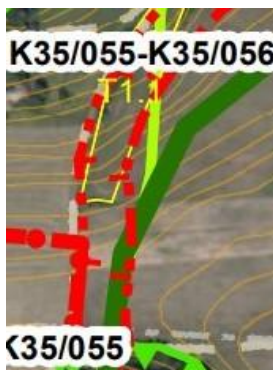
návrh v Plánu místního ÚSES ORP Nová Paka