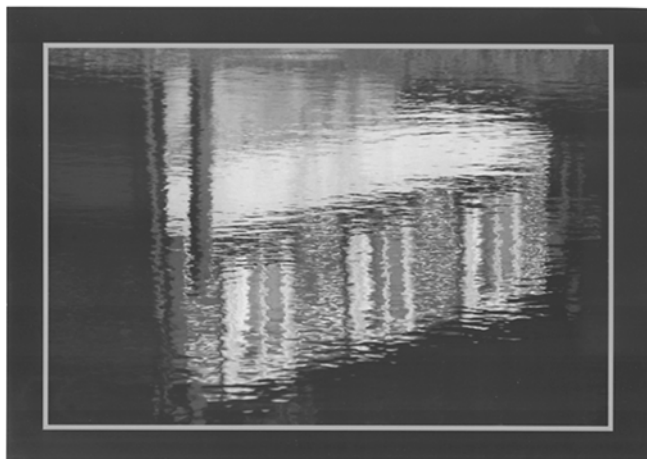
Vítězný snímek Tomáše Bergra - zmenšený otisk se samozřejmě s originálem nemůže rovnat...

Všechny fotografie budou vystaveny od 1. července do 30. září ve vstupní chodbě peckovského hradu. -vt-